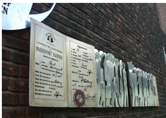
Le mémorial de F. Nansen et du passeport Nansen à Oslo (Norvège) [il se situe sur le côté de l'hôtel de ville, le Radhuset] © cliché JF Pellan – juin 2011